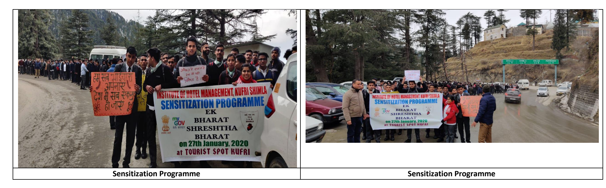
Sensitization Programme/ Awareness Programme for the Stake Holders in Kufri