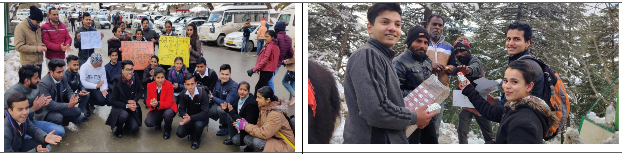
Students of IHM Kufri in action during Nukkad Natak