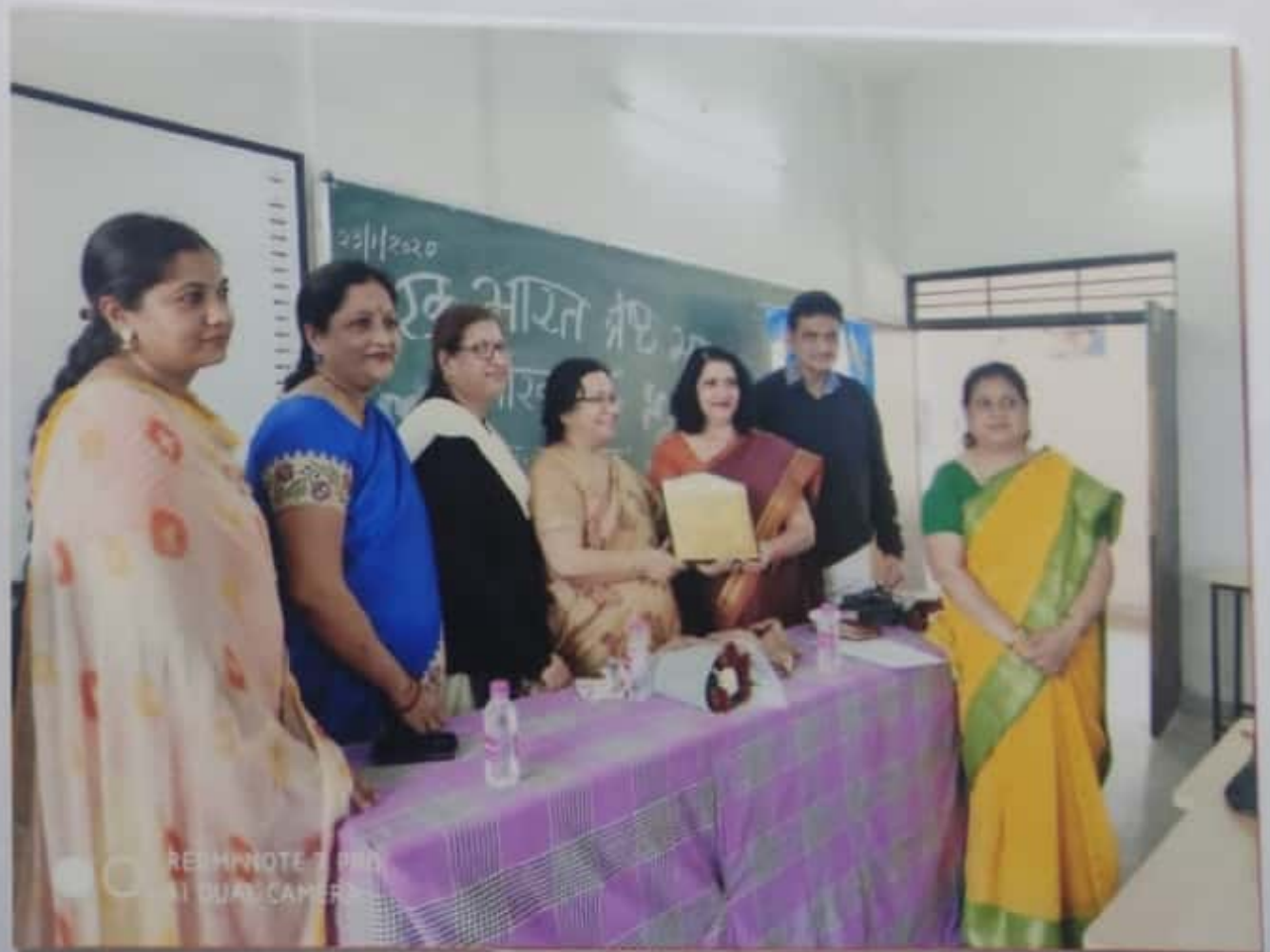
EBSB DAY - व्याख्यान 23/1/2020