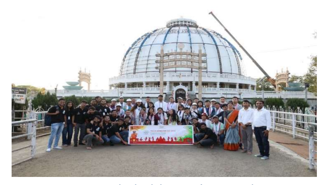
At Deekshabhoomi Temple

After that they were departed for sightseeing at various spots including Deekshabhoomi, Zero mile (the geographical centre of colonial India), and the Koradi temple.