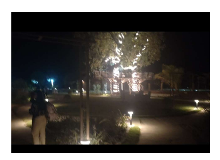
Night view of the Oreint Woods Resort