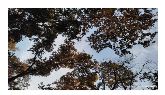
The beauty of Pench Jungle

1. Paryatan (Tourism) : During their visit to Nagpur, we introduce them to some of the famous tourist spots like-Deeksha Bhoomi which is the third largest hollow Buddhist Stupa in the world. Koradi Temple, the temple of Shri Mahalaxmi Jagadamba and The Pench Tiger National Park which is one of the most glorious destinations for the nature lovers.