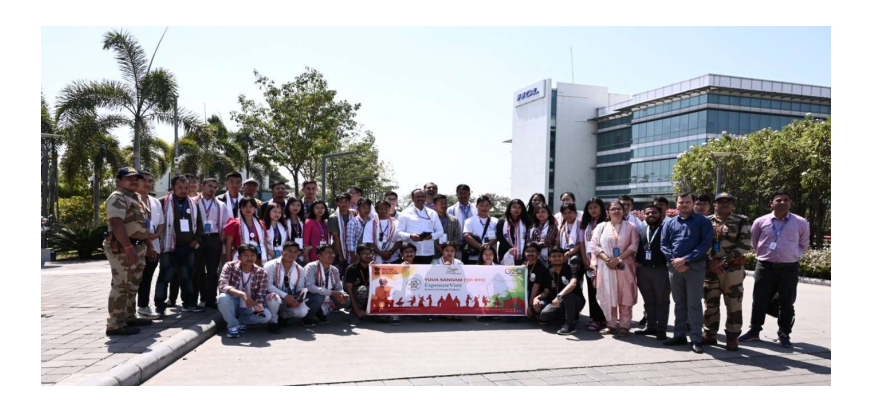
A group photo with the Staff of HCL Company

5)Paraspar sampark (People to People connect): As we all know that youth are the important pillar of the nation and they should remain committed towards the development of the nation. The future of the nation lies in the all-around development of youth. Hence youth play a supreme role in nation-building.