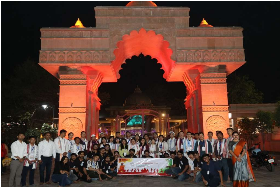
At Koradi Temple