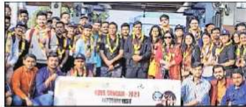
The participant of the 'Yuva Sangam' visit.