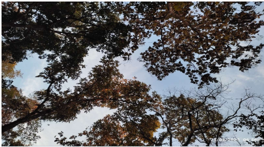
The beauty of Pench Jungle