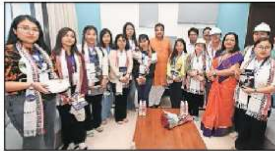
Union Minister Nitin Gadkari snapped with delegates of Manipur on visit to city as part of Yuva Sangam programme.