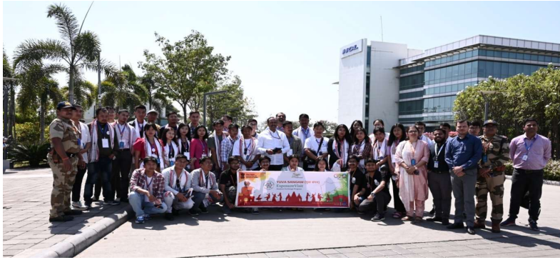
A group photo with the Staff of HCL Company

5)Paraspar sampark (People to People connect): As we all know that youth are the important pillar of the nation and they should remain committed towards the development of the nation. The future of the nation lies in the all-around development of youth. Hence youth play a supreme role in nation-building.