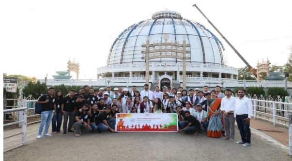
At Deekshabhoomi Temple

After that they were departed for sightseeing at various spots including Deekshabhoomi, Zero mile (the geographical centre of colonial India), and the Koradi temple.