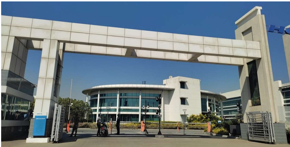
HCL Company Building

Visiting CSIR-NEERI is also one of the most interesting industrial visits for them and as well as for me also. The Manager of this institution gives us a valuable information about research and developmental studies in environmental science and engineering.