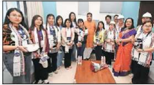
Union Minister Nitin Gadkari snapped with delegates of Manipur on visit to city as part of Yuva Sangam programme.